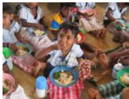
幼児教室で栄養補助食を食べる子どもたち