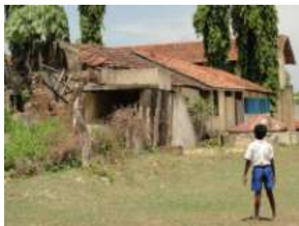
破壊された幼児教室を呆然と見つめる児童

その村の一つ、ムトゥール郡チョナイヨル村は、トリンコマレ市内から約60km南に位置する人口1,025人の村です。紛争時の攻撃により、多くの建物が破壊され、人々は家を失いました。また、帰還してもこの村には仕事がなく、多くの人々が現在も1日300～500ルピー（約240～400円）の日雇い道路工事などで生計を立てています。