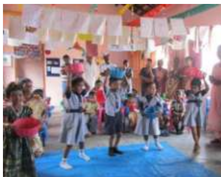
新しく建設された幼児教室。元気な子どもたちの笑い声が絶えません。